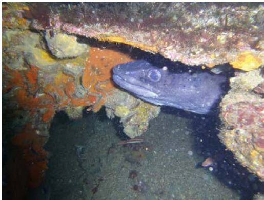
Animal – Chordé – Congre

Identifie les 4 organismes illustrés sur les photos (règne-embranchement-nom familier)