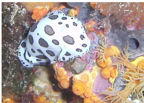
Animal – Mollusque – Doris dalmatien