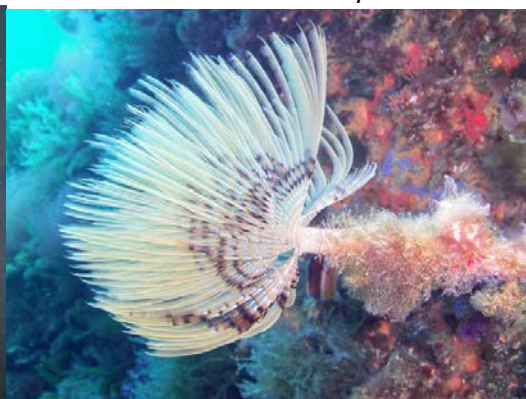
Animal – Annelide – Spirographe