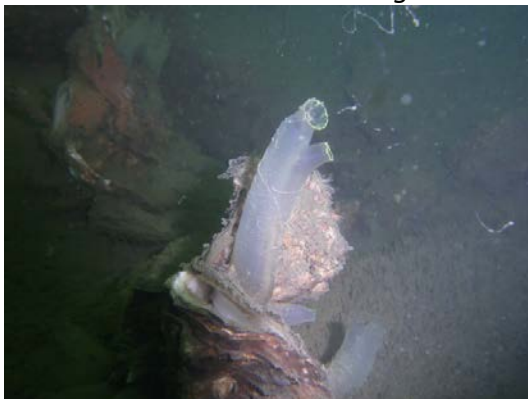
Animal- Chordé-ascidie jaune